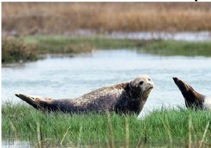
Phoque veau-marin